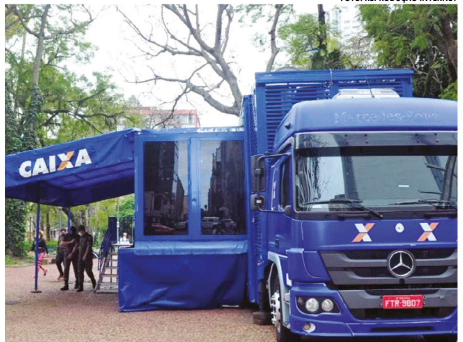
O caminhão ficará à disposição da comunidade no estacionamento do Shopping Sul

Ação oferece condições especiais para a liquidação de contratos comerciais e negociação de créditos habitacionais em atraso