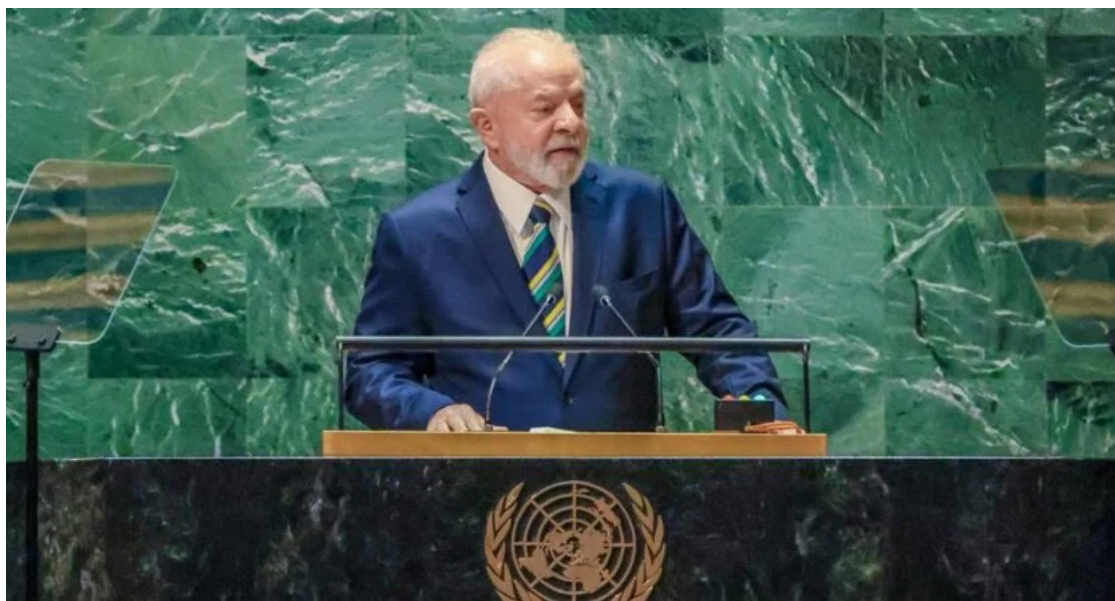
Lula da Silva, em discurso no plenário da ONU, em Nova Iorque: novo pacto político mundial

Lula não se referiu diretamente à Rússia nem a Vladimir Putin quando falou da Guerra na Ucrânia, e mencionou outros conflitos mundiais para reforçar que “nenhuma solução será duradoura se não for pau-