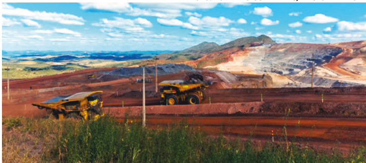
Indústria extrativa mineral é a principal responsável pelo crescimento do setor