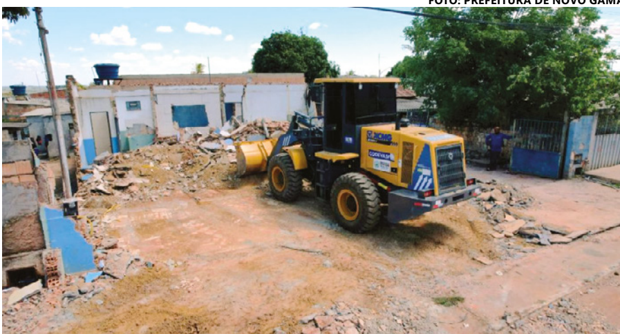
Demolição da antiga ESF para dar espaço à nova unidade de saúde.

A nova infraestrutura incluirá características semelhantes às da ESF Equipe 3, como estacionamento externo e recepção