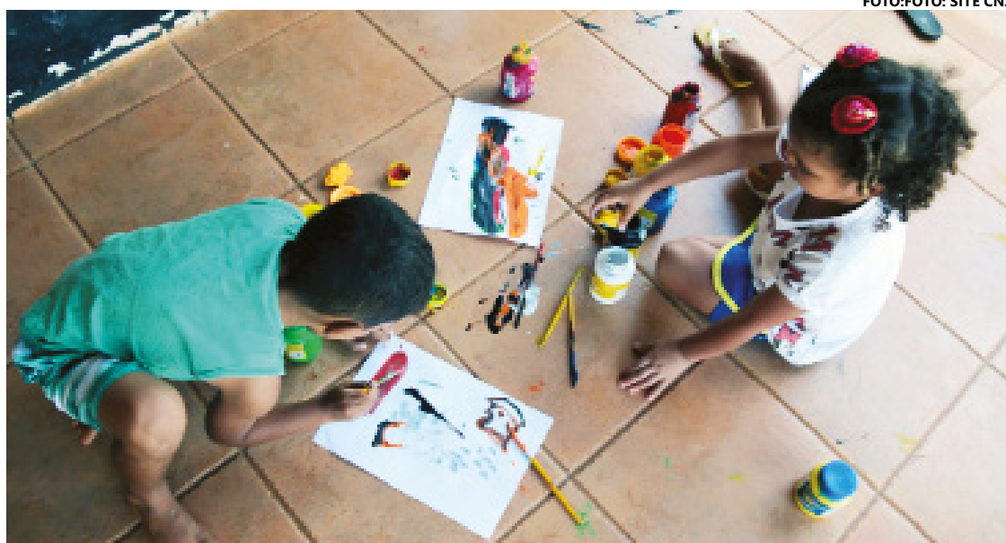
Evento será realizado nesta sexta-feira, 22

O objetivo principal deste seminário é apresentar os progressos e contribuições obtidos ao longo dos quatro anos de implementação do "Pacto Nacional pela Primeira Infância". Isso ocorre conforme o princípio da prioridade absoluta, previsto no artigo 227 da Constituição Fe-