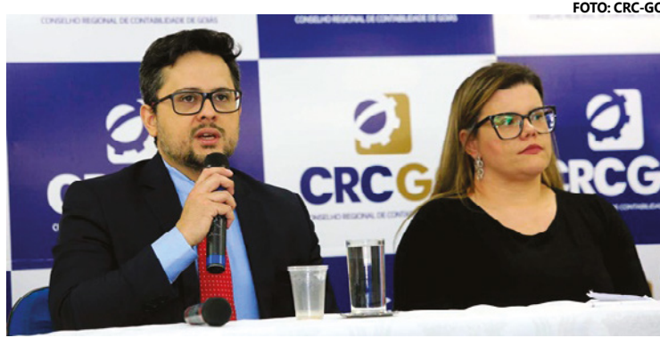
Imposto de Renda solidário destina até 6% do valor para vulneráveis