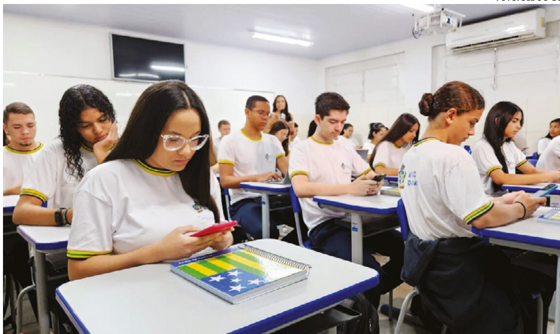
Os estudos realizados na plataforma digital vão complementar o ensino presencial que é feito em sala de aula.

Com isso, os usuários do aplicativo passarão a visualizar também o status do pagamento mensal do Bolsa Estudo. É possível acompanhar se o dinheiro já