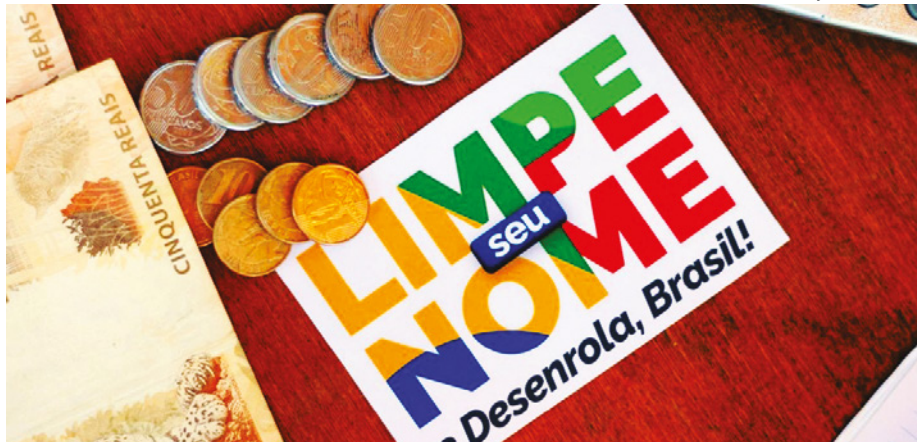
Informação é da Febraban e foi divulgada na última segunda-feira (18).