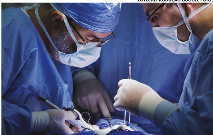
Mais de 65 mil pessoas aguardam na lista de espera por órgãos