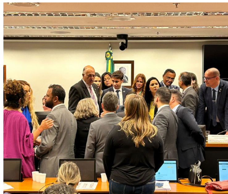
Deputados levantam questões religiosas contra casamento igualitário

A sessão foi encerrada sem apreciação do mérito da pauta e postergada a votação para a próxima quarta-feira, 27, um dia após a realização da tão esperada audiência pública.