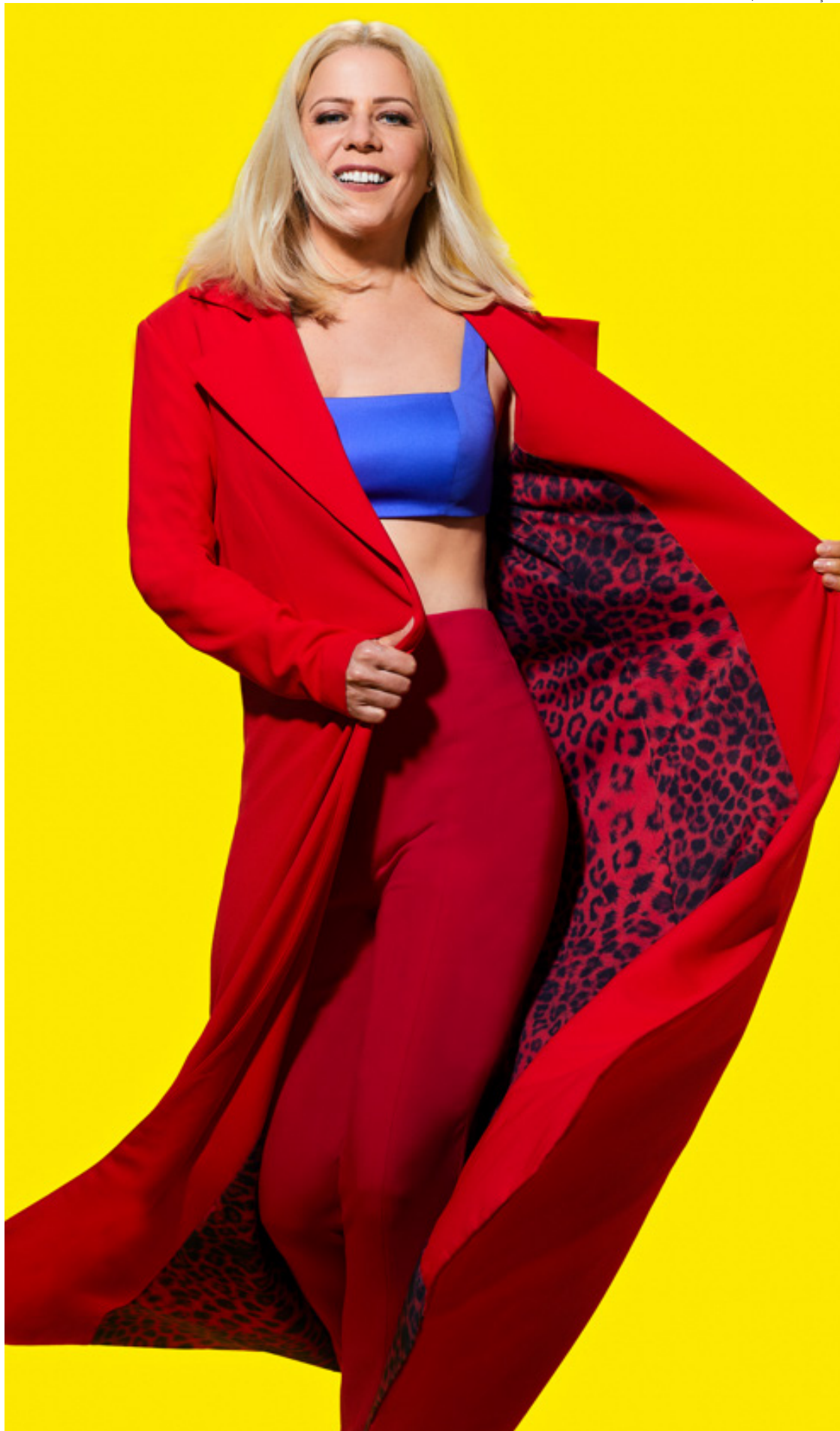
Eu quero você, como eu quero: cantora promete espetáculo com clássicos e nova canção