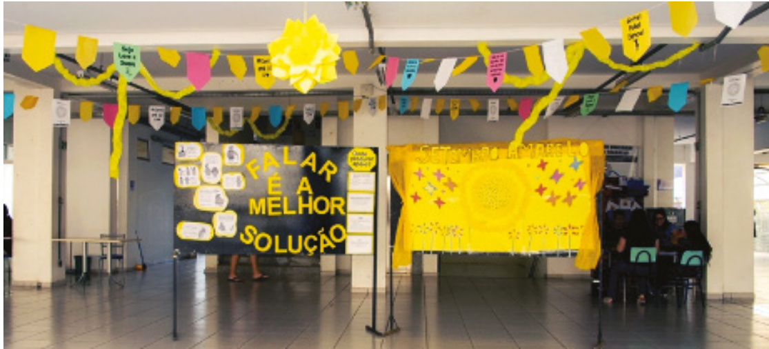
O evento contará com uma série de atividades e informações essenciais.

A programação incluirá diversas atividades relacionadas à preservação ambiental, como a produção de brinquedos a partir de materiais reciclados, pintura facial para crianças, um espaço de diversão com pula-pula e muito mais. Além disso, serão ofere-