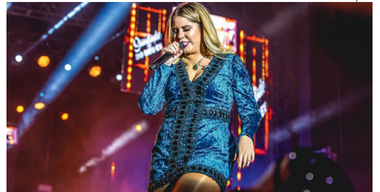
Rainha do feminejo: artista quebra barreiras mesmo sem estar entre nós