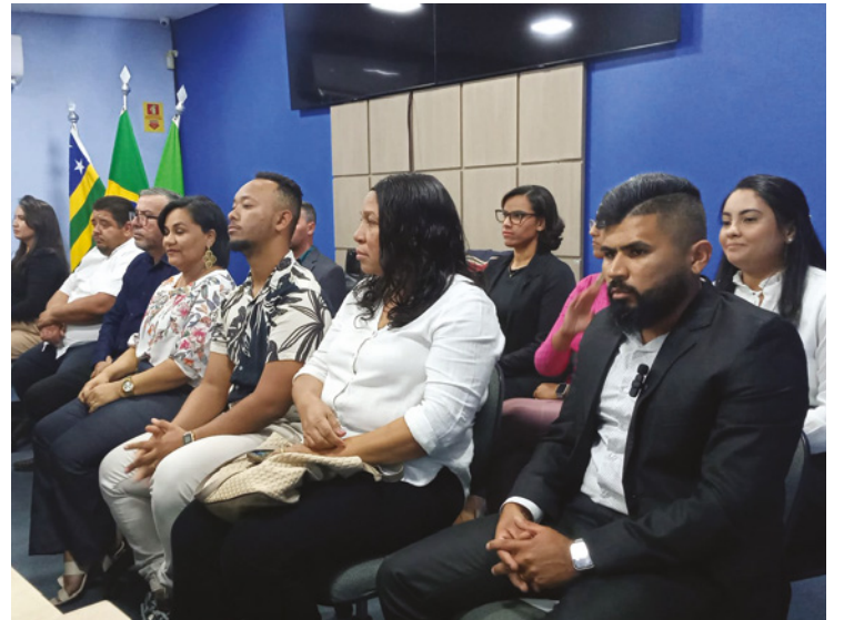
Alguns candidatos durante homolação das candidaturas