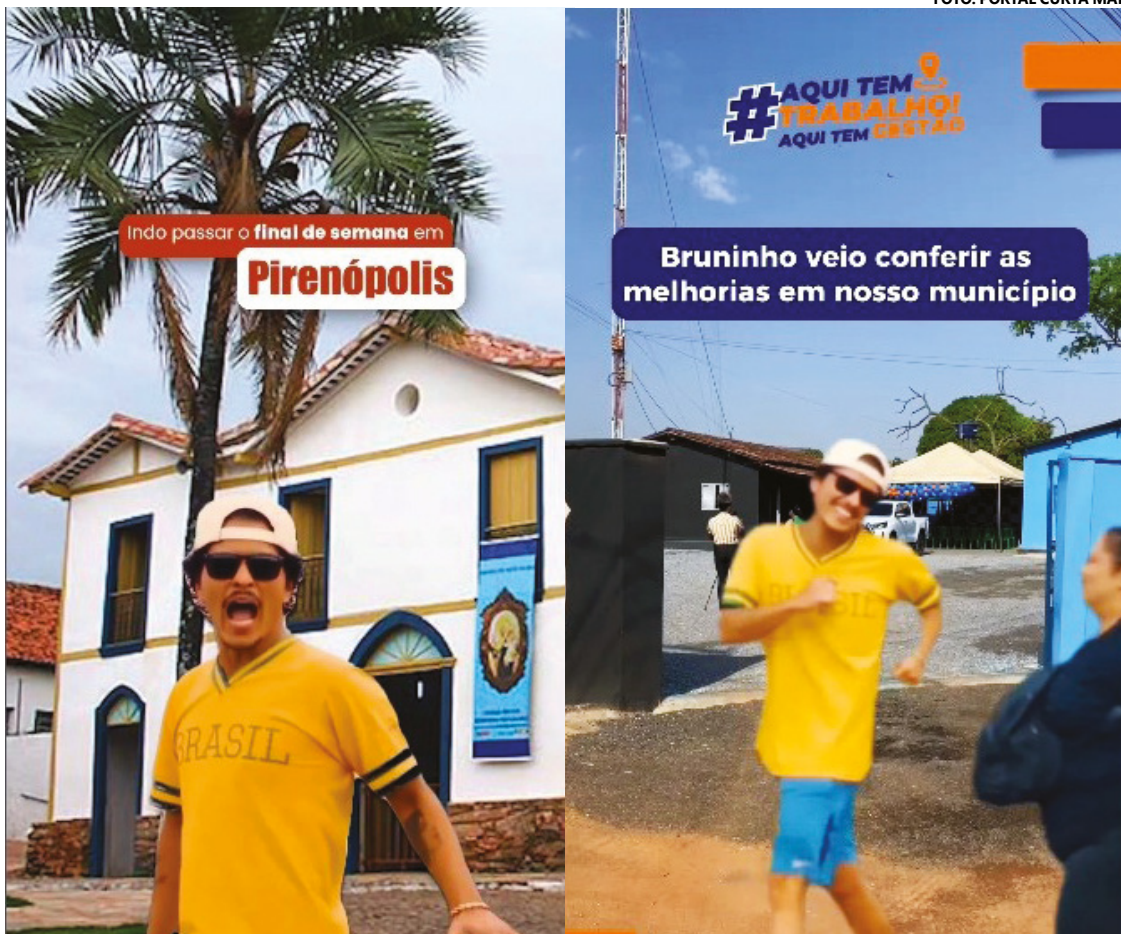
Meme publicado no perfil oficial do município de Pirenópolis e Vila Propício

Ambos os perfis usaram o meme do cantor para um propósito diferente. Pirenópolis quis ressaltar o turismo, apresentando as mais belas paisagens naturais que são consideradas patrimônio cultural e imaterial. Vila Propício, por outro lado, mostrou aos seus habitantes as novas melhorias que trarão mais conforto e qualidade de vida. O que realmente importa é a criatividade e a diversão que aproximam a população dos acontecimentos locais.