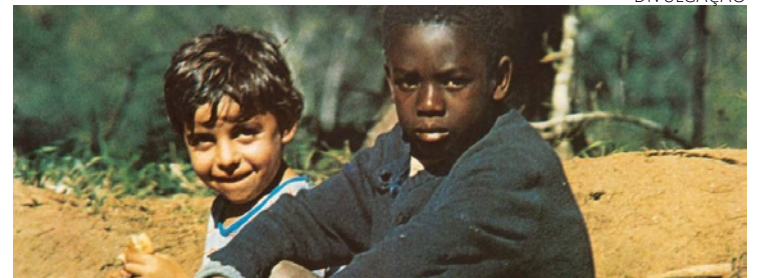
Clássico: 'Clube da Esquina' é o trabalho mais bem avaliado