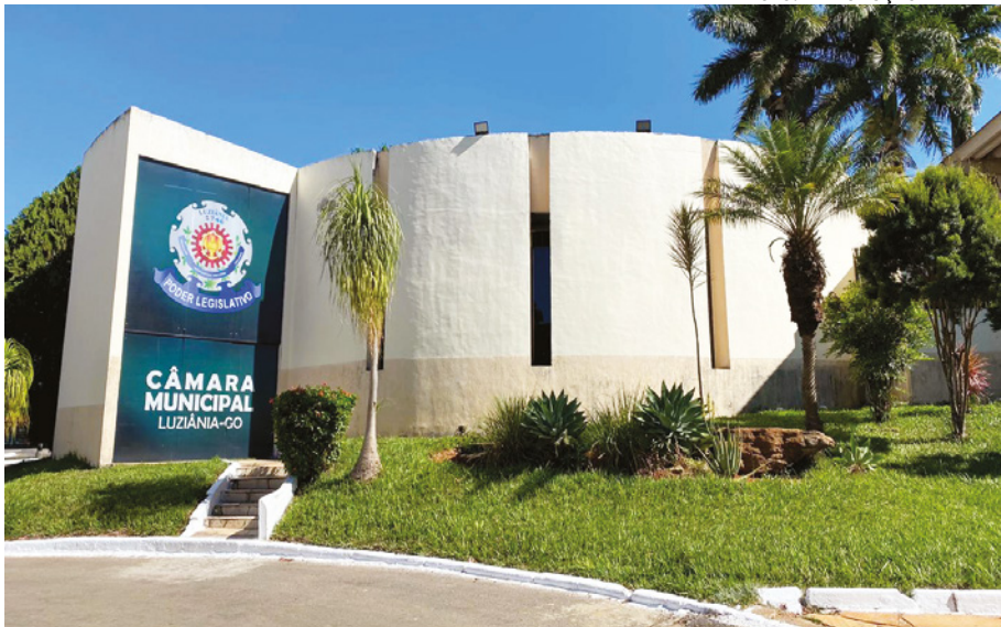
O projeto de lei é de autoria do Poder Executivo