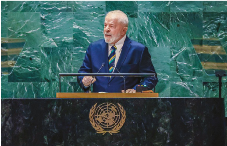
Esta é a oitava vez que o presidente Lula abre o debate dos chefes de Estado

Segundo o presidente, para vencer as desigualdades, é preciso vencer a resignação e a falta de vontade política daqueles que governam o mundo.